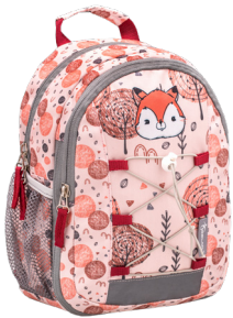
Woodland Animal Foxy

6 Zwei Seitentaschen - geeignet zum Verstauen einer Wasserflasche (0,5 L)