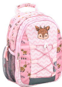
Woodland Animal Deer