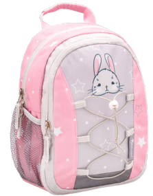
Woodland Animal Rabbit