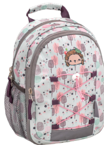
Woodland Animal Hedgehog