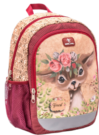
Animal Forest Bambi